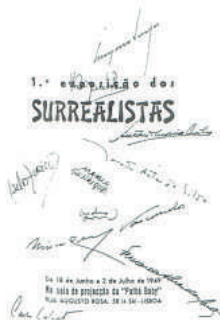
Catálogo autografado pelos Surrealistas na I Exposição

(prefácio aos "Textos de Afirmção e Combate do Movimento Surrealista Mundial" P&R, Lisboa, 1977)